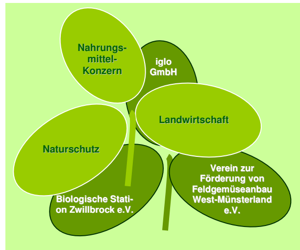
Abb. 2: Partner im Erprobungs- und Entwicklungsprojekt „Biodiversität in der Agrarlandschaft“

Das Projekt „Biodiversität in der Agrarlandschaft“ entstand auf Initiative von iglo. Nachhaltigkeit zählt zu den angestrebten Konzernzielen, und so entstand ein erster Kontakt zwischen iglo und der Biologischen Station Zwillbrock e.V. mit dem Ziel, bei der Gemüseproduktion auch eine Nachhaltig-