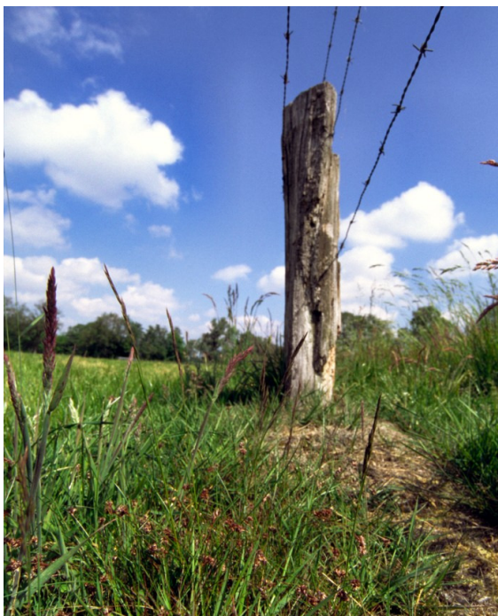
Abb. 1: Weidezäune sind wichtige Strukturen für den Erhalt von Biologischer Vielfalt in der Kulturlandschaft

Damit hat sich die Rolle der Landwirtschaft für den Erhalt der Biologischen Vielfalt in unserer Kulturlandschaft verändert: